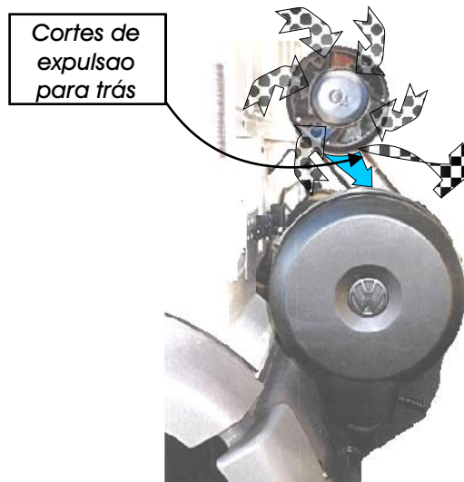
Pre-filtro O 4